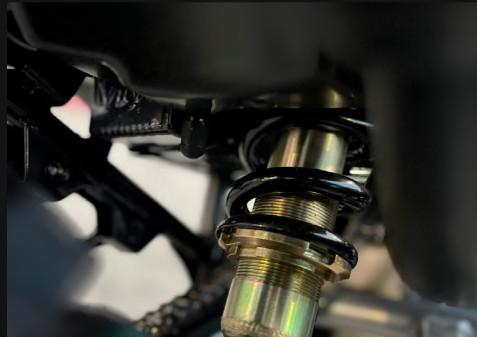
SUSPENSIÓN DEL. BARRAS TEL. Y POST. MONOSHOCK