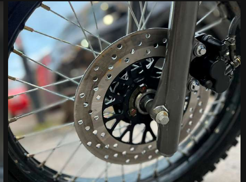
FRENO DE DISCO DELANTERO Y TAMBOR POSTERIOR