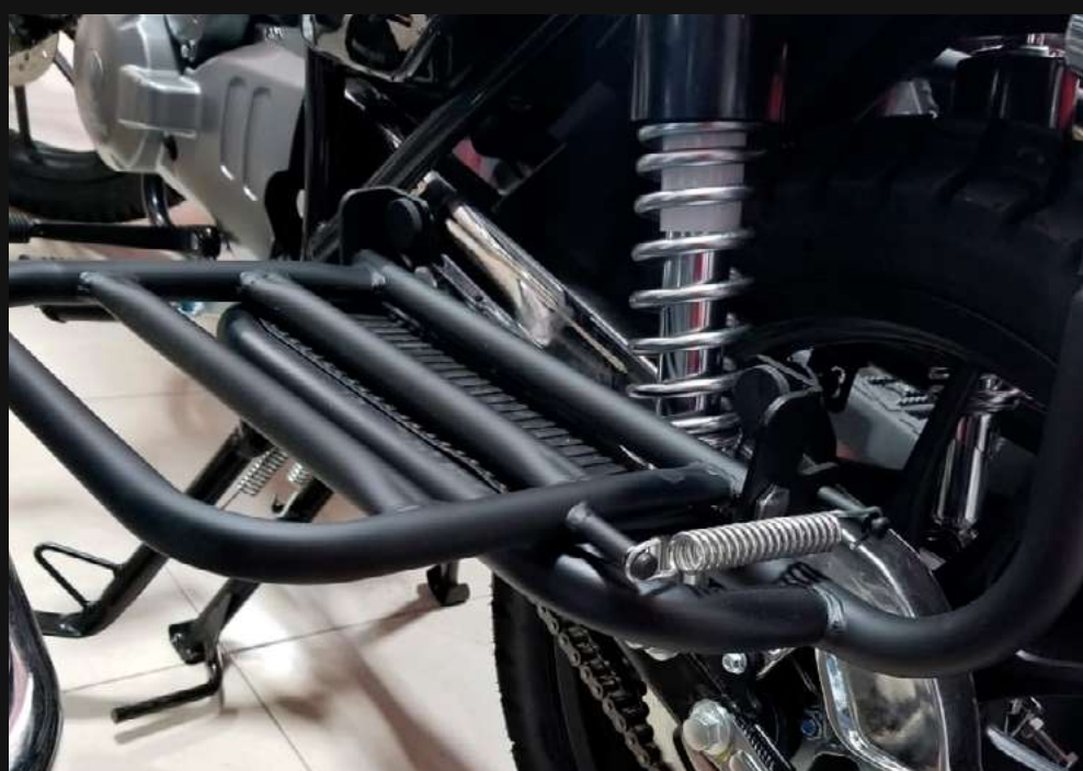
DOBLE AMORTIGUADOR CON RESORTE HELICOIDAL