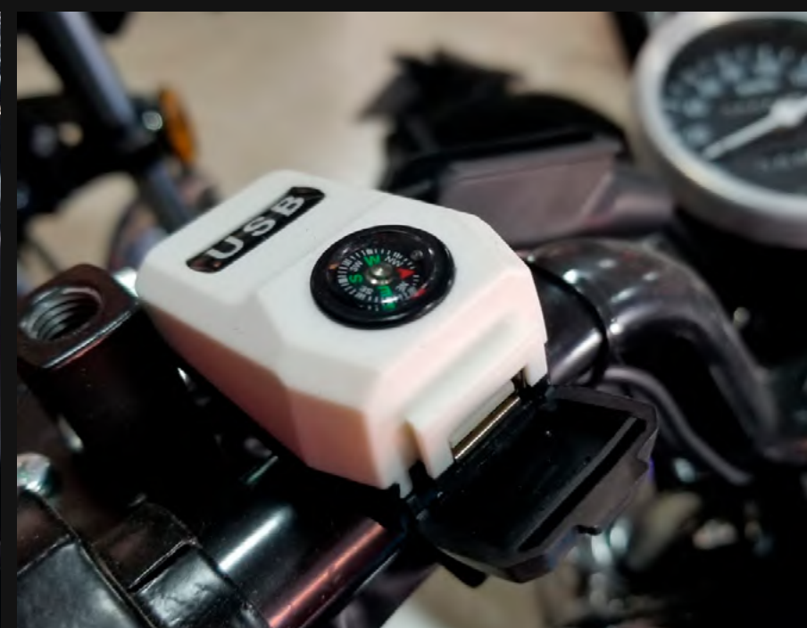
ENTRADA USB MUTIFUNCIONAL