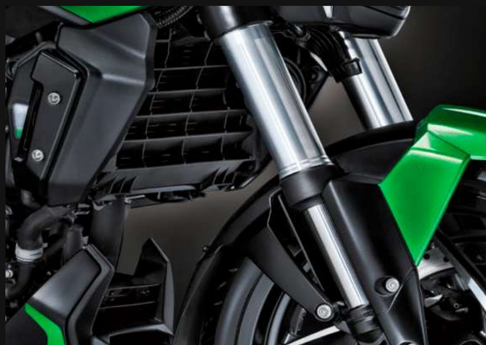
RADIADOR DE AGUA + BARRAS INVERTIDAS