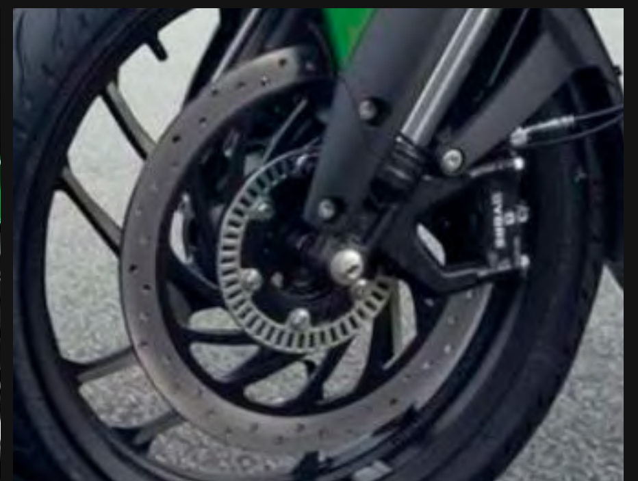
DISCO DE FRENO DELANTERO Y POSTERIOR CON ABS