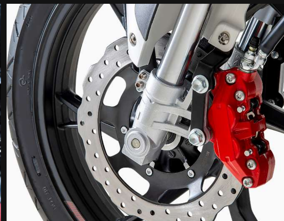
FRENO DE DISCO DELANTERO Y POSTERIOR