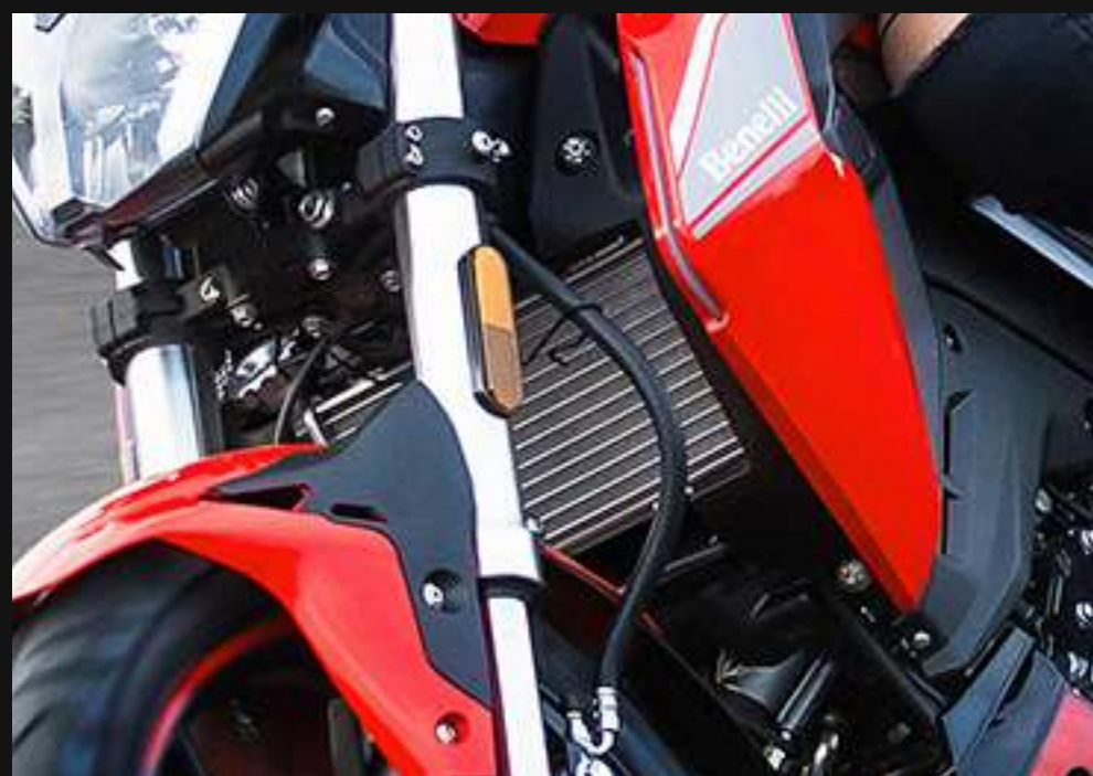
RADIADOR DE AGUA